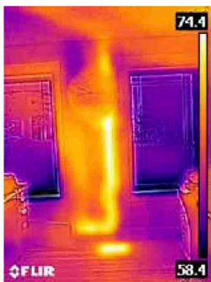
Теплая отводная труба в стене