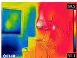
Неизолированная наружная стена